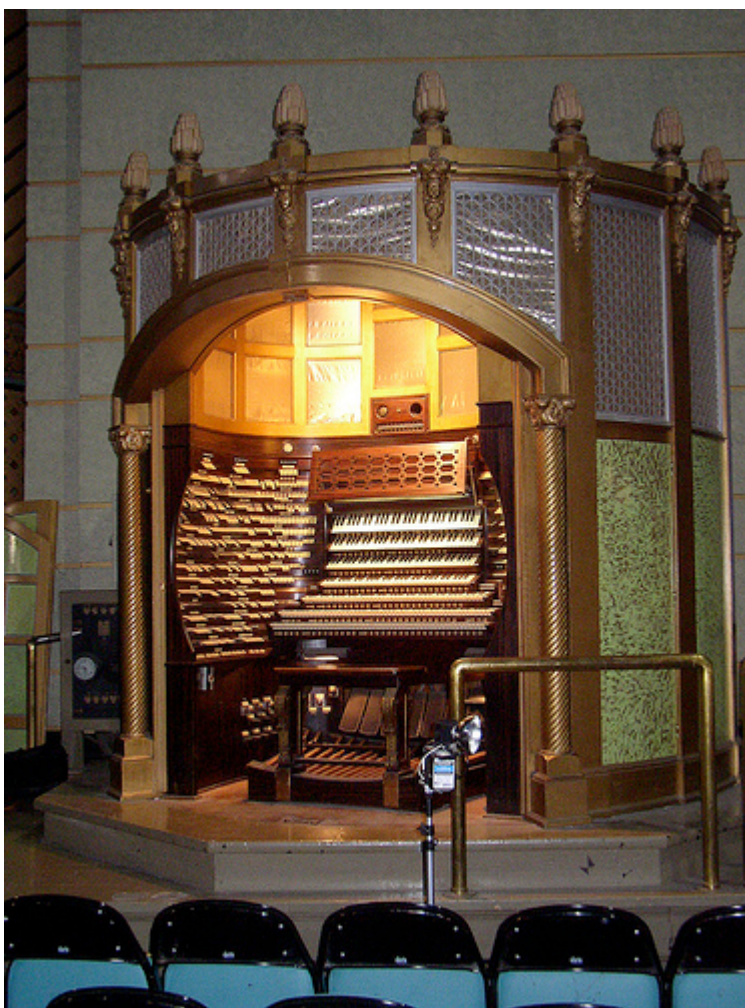
Pipe Organ in the Boardwalk Hall, Atlantic City.

(摘自司琴的基本技巧與觀念 - http://www.praiseu.com/sharemusic/piano01/piano01-6.htm )