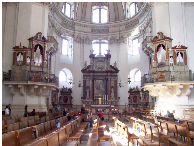
Pipe Organ in the Dom of the Salzburg, Austria.