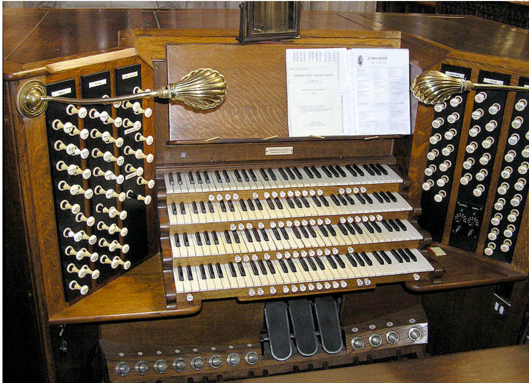
Organ console in St Mary Recliffe Church, Bristol.