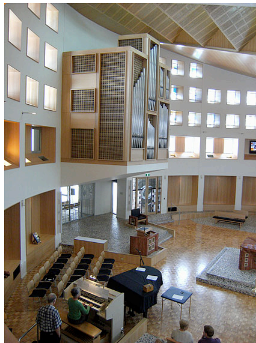
Organ at the Church Of St. John the Baptist Catholic Church, Woy Woy on the Central Coast of New South Wales (From Winter 2008 Sydney Organ Journal, Photos by Dean Yates)